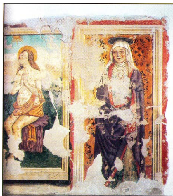
(Fig. 1) a destra affresco, Sant'Anna , primi anni XVI sec. a sinistra affresco, San Giobbe , primo quarto del XVI sec.

La chiesa oggi contiene una serie di affreschi apparentemente non collegati tra loro, ma di certo eseguiti quasi contemporaneamente e in ogni caso in un lasso di tempo relativamente lungo. Compreso l'affresco posto in facciata all'interno del portico, oggi a seguito dei restauri Sant'Anna conta complessivamente otto diversi dipinti, che qui di seguito verranno descritti e dei quali si cercherà di dare una lettura storico - critica ed artistica.