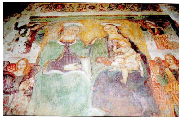
Alfresco del Portico, parete esterna. Madonna con Bambino e Sant'Anna incinta , prima metà del XVI sec. (1535-1536 ?)