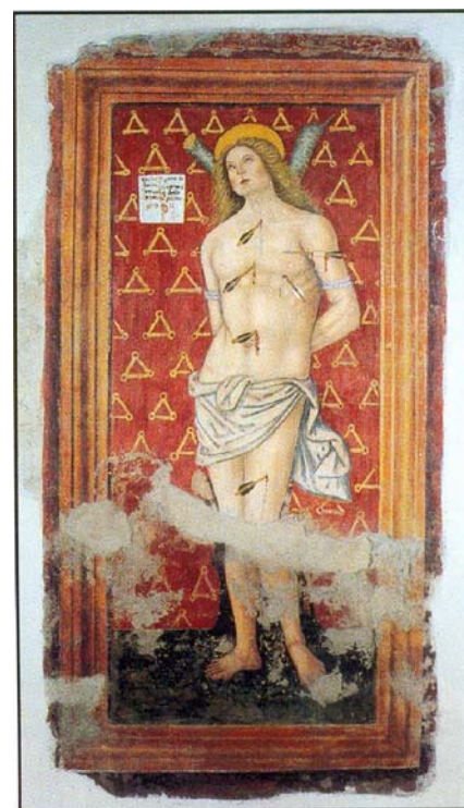
Affresco, San Sebastiano , primo quarto XVI sec. (1512 ?)

Addolorata, che alcuni pii benefattori avevano appena "rivestita" grazie al denaro raccolto con una colletta.