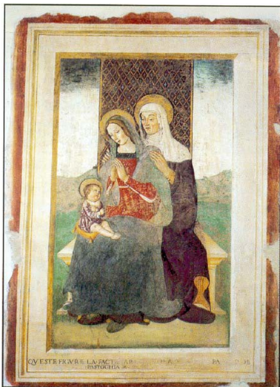
Affresco, Sant'Anna Metterza che sostiene sulle ginocchia la Madonna con Bambino , primi anni XVI sec.

associazione nazionale per la tutela e la valorizzazione del patrimonio storico-artistico e ambientale