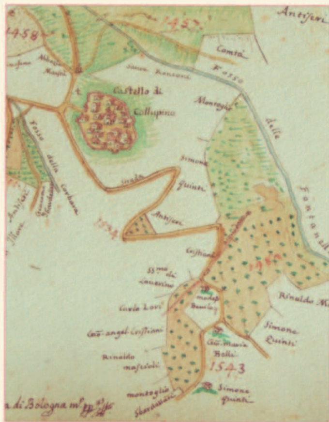
Cabreo di Vallegloria n° 43 (1774) firmato Giuseppe Maria Ghelli Archivio di Stato di Foligno